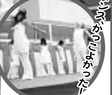
舞姫のダンスは大人っぽくて魅力的でした!