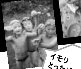
登山家になれるかも!