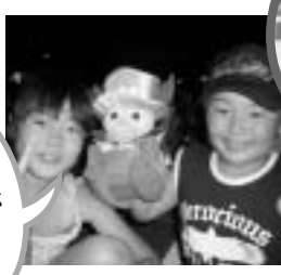
ゲームをゲットしたよ