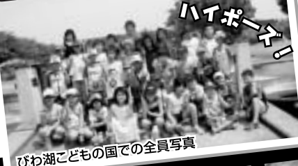
びわ湖こどもの国での全員写真

今年のサマーキャンプは、過去最高人数の30名参加で、滋賀県高島市マキノ町へ…。ビーチや川での遊びや、体験教室での工作、花火に肝試し…。充実の2日間に、みんな楽しんでいました。