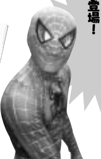
スパイダーマンも登場!