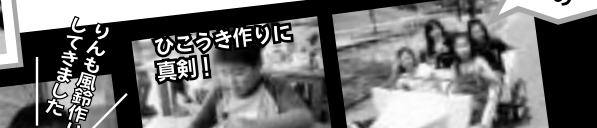
ひざろき作りは真剣!