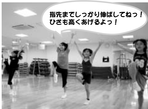
指先までしっかり伸ばしてねっ! ひざも高くあげるよっ!