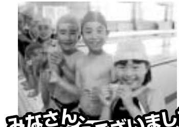
みなさんおめでとうございました!!