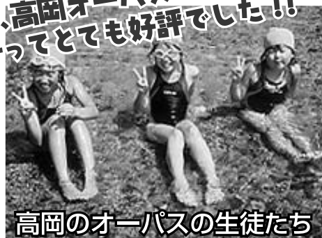
高岡のオーパスの生徒たち