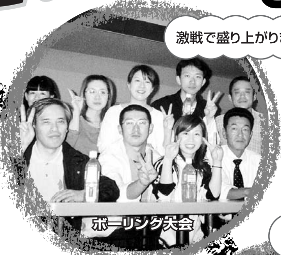
ボレーシング大会