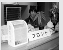
カウンターに募金箱を設置しています。