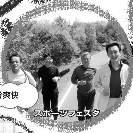
スポーツフェスタ