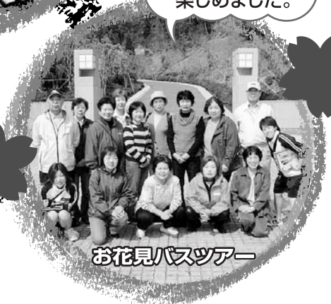
お花見バスツアー