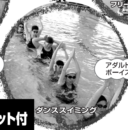
ダンススイミング