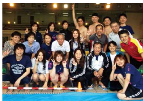
前回の富山県マスターズ大会の様子 サークル史上最多の25名が参加し全95チーム出場のうち3番目の出場者数でした。

生涯スポーツと言われるほど、幅広い年齢層に愛されている「水泳」マスターズサークルでは、水泳の基本練習から、飛び込みやターンなどの発展練習も織り交ぜて練習しています。