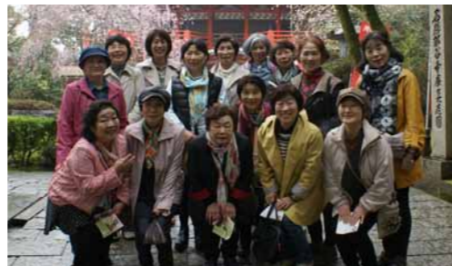
前回、さんぽに行った石川県の那谷寺桜がとても綺麗な穴場スポットでした！

春には桜、秋には紅葉を楽しみながら県内外の隠れた名所を散歩するサークルです。景色を楽しむのはもちろん、温泉に入ったりして、ちょっとした小旅行気分で行っています。