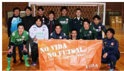
フットサルに興味のある方は是非体験に来て下さい！女性も大歓迎です！

日本国内で300万人もの愛好者がいる人気スポーツのフットサル。オーパスフットサルサークルは北信越リーグに所属し現役のプレイヤーがフットサルの醍醐味を、遊びを織り交ぜた練習で楽しく指導してくれます。